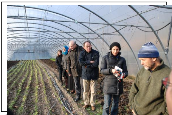
Le Béal, coin de champ, décembre 2012

En décembre 2012, le foyer de vie Le Béal a accueilli une rencontre au « coin du champ »...Plus de 20 personnes ont souhaité y participer. Cette visite a permis de découvrir cette communauté de vie qui accueille une vingtaine de personnes souffrant de handicaps divers.