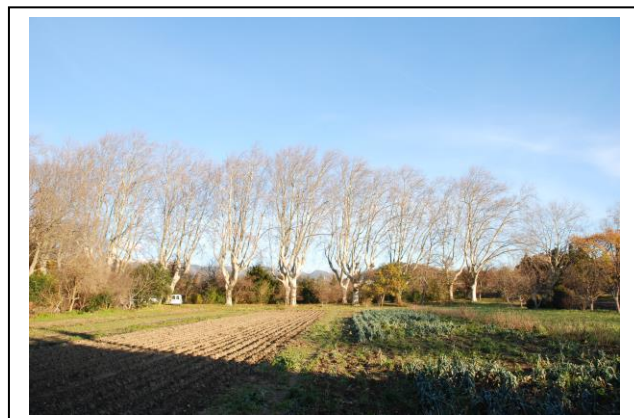
Le Béal, coin de champ, décembre 2012

Nos propositions pour ce nouveau programme très prochainement.