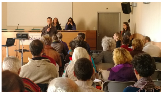
Les 5èmes Rencontres d'ASTRA, novembre 2014

Pour cette raison, le Réseau ASTRA souhaite engager une réflexion sur la faisabilité d'une labellisation du type « Agriculture socialement responsable » des produits et services issus de l'agriculture sociale. Cela se fera de façon concertée, en consultant les partenaires intéressés par cet enjeu. Pour afficher nos valeurs et permettre à ceux qui utilisent les produits et services de l'agriculture sociale, de le faire en connaissance de cause. Il s'agit d'une autre façon, on pourrait dire citoyenne, de faire reconnaître l'agriculture sociale.