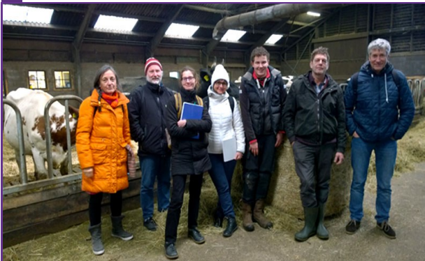
Le groupe ASTRA en visite dans cette ferme

Les objectifs de la structure sont la réhabilitation, la resocialisation et l'insertion professionnelle (par le logement et l'emploi). Les personnes accueillies peuvent rester jusqu'à 5 ans, elles sont accompagnées pour trouver un emploi sur le marché du travail ordinaire. C'est aussi un lieu de formation pour des professionnels. Toutes les 6 semaines, un professionnel intervient pour former l'équipe.