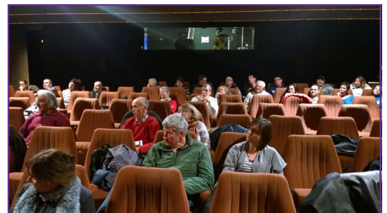
« ASTRA fait son cinéma » à l'Espace Malraux, décembre 2015

té des structures d'agriculture sociale reconnus en tant que tel ? La réponse n'est pas si simple, au vu des initiatives déjà prises de façon dispersée par certains réseaux.