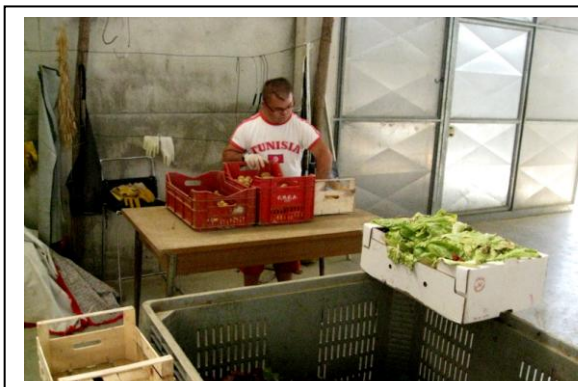
Personne handicapée au travail à la Ferme maraîchère bio Colombini (Pise, Toscane, Italie)

Nous vous donnons donc rendez-vous le 9 Novembre pour débattre de ces questions lors des Secondes Journées de l'agriculture sociale et thérapeutique en Rhône-Alpes.